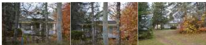
2016_22010_GING_0127_01 2016_22010_GING_0127_08 2016_22010_GING_0127_13