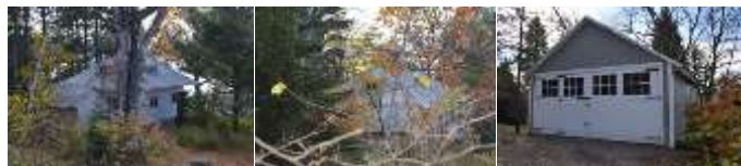
2016_22010_FOSS_6135_08 2016_22010_FOSS_6135_09 2016_22010_FOSS_6135_10