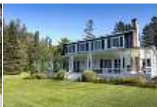
IMG_2320 iFX Productions