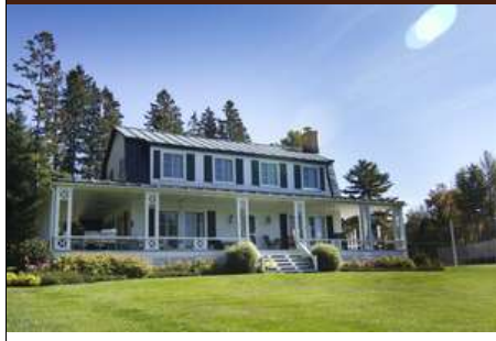
IMG_2322 iFX Productions