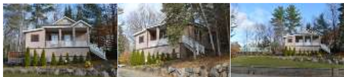
2016_22010_FOSS_6162_01 2016_22010_FOSS_6162_08 2016_22010_FOSS_6162_13