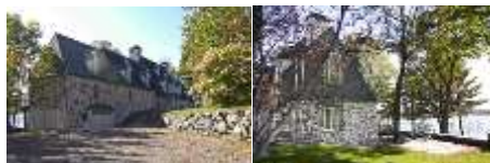
IMG_2346 iFX Productions