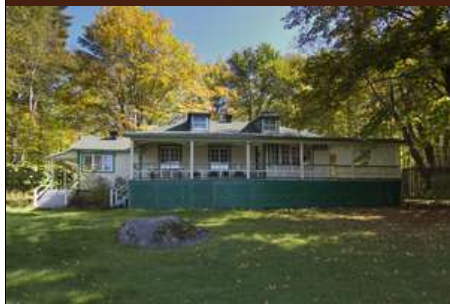
IMG_2306 iFX Productions