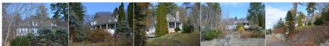
2016_22010_FOSS_6136_01 2016_22010_FOSS_6136_08 2016_22010_FOSS_6136_07 2016_22010_FOSS_6136_13_02 2016_22010_FOSS_6136_13_1 2008_22010_FOSS_6136_08_01