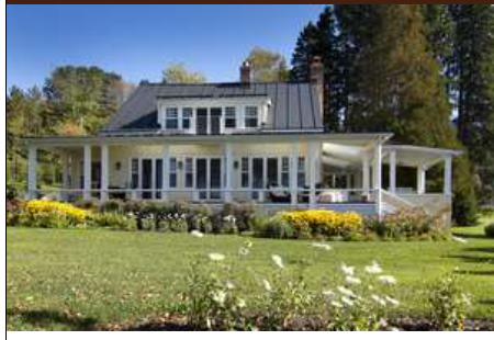
IMG_2328 iFX Productions