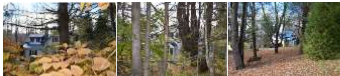
2016_22010_FOSS_6123_01_ 2016_22010_FOSS_6123_08 2016_22010_FOSS_6123_13