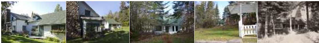
IMG_2363 iFX Productions