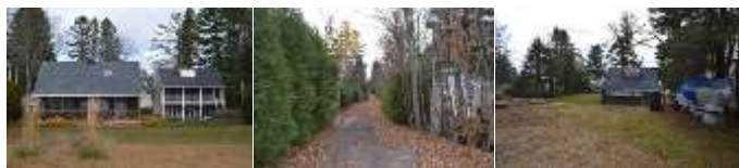
2016_22010_FOSS_6175_05 2016_22010_FOSS_6175_11 2016_22010_FOSS_6175_13