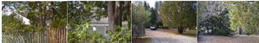
2016_22010_FOSS_6131_02 2016_22010_FOSS_6131_09_ 2016_22010_FOSS_6131_11 2016_22010_FOSS_6131_13