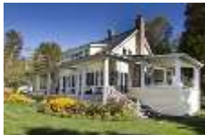
IMG_2325 iFX Productions