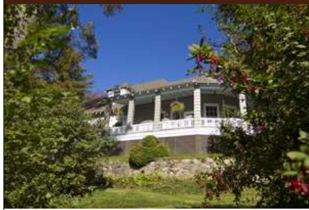
IMG_2367 iFX Productions