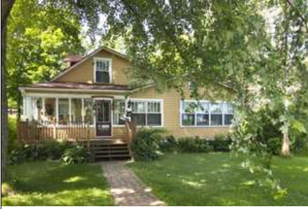
IMG_0113_31 AnseBellevue iFX Productions