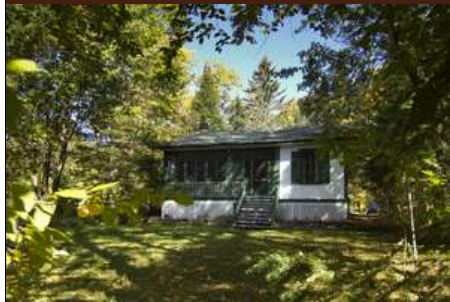
IMG_2312 iFX Productions