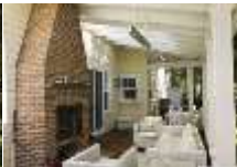
IMG_2333 iFX Productions