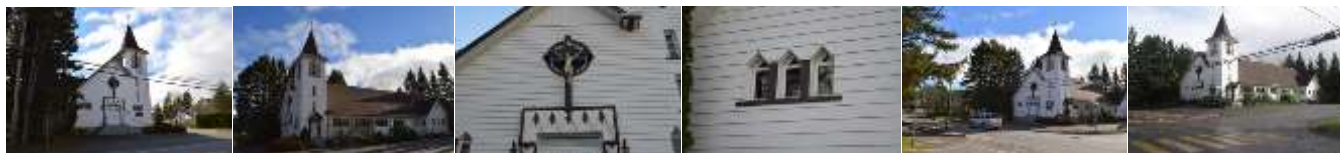
2016_22010_GING_0230_02 2016_22010_GING_0230_07 2016_22010_GING_0230_09_03 2016_22010_GING_0230_09_03 2016_22010_GING_0230_13 2008_22010_GING_0230_13_01