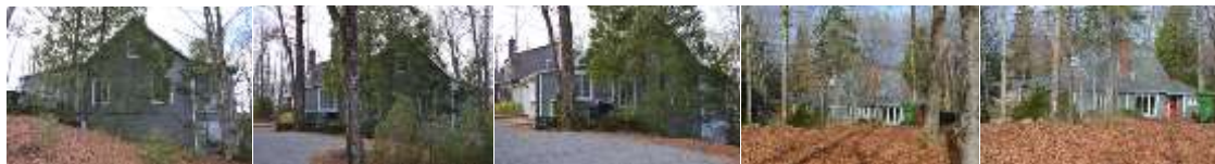
2016_22010_KELL_0007_03_0 2016_22010_KELL_0007_03 2016_22010_KELL_0007_04 2016_22010_KELL_0007_06_02 2016_22010_KELL_0007_06 2008_22010_KELL_0007_01_01