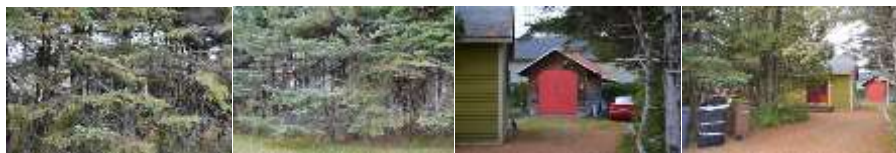
2016_22010_GERM_0004_01 2016_22010_GERM_0004_02 2016_22010_GERM_0004_10 2016_22010_GERM_0004_13