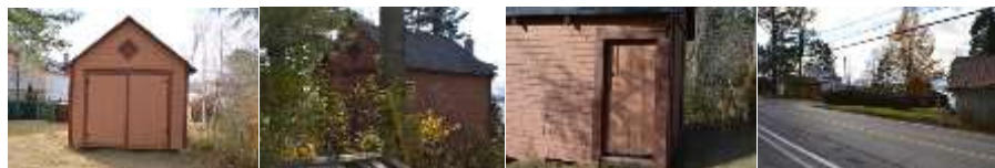
2016_22010_FOSS_6157_01 2016_22010_FOSS_6157_08 2016_22010_FOSS_6157_09 2016_22010_FOSS_6157_13