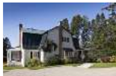
IMG_2337 iFX Productions