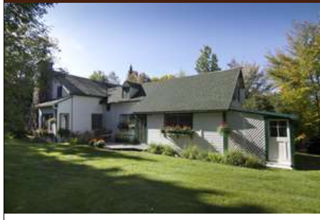
IMG_2356 iFX Productions