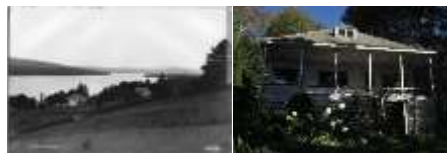
2008_22010_FOSS_6137_13_0 2008_22010_FOSS_6137_01_0 2 1